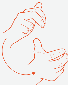
Teiknet for n i det samiske eihandsalfabetet.

Teiknspråksrådgjevaren skal mellom anna gje råd om bruk av teiknspråk til det offentlege og til privatpersonar, informere om kva språklege rettar teiknspråksbrukarar har, og utvikle samarbeid med ulike fag- og interesseorganisasjonar som arbeider for og med teiknspråk.